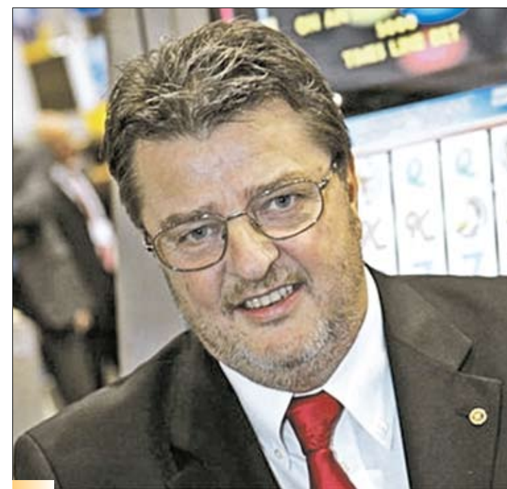
Глава группы Novomatic Иоганн Граф

Она сложилась на пересечении трех культурных составляющих: романской, германской и славянской. Но вначале три тысячи лет назад здесь поселились племена иллирийцев. Известно, что они обладали развитой духовностью, что в дальнейшем и привело, очевидно, к появлению в этих местах плеяды великих музыкантов. Позднее иллирийцев сменили кельты, которые образовали государство Норикум. Местность была красивой, и немудрено, что любоваться альпийскими