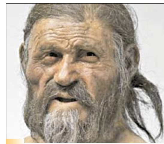
Лицо «Ледяного человека», жившего более 5000 лет назад. Реконструкция

цев (Вот тебе, бабушка, и крейцера соната!).