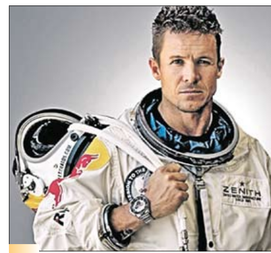
Прыгун и рекордсмен Феликс Баумгартнер

церов (Вот тебе, бабушка, и крейцера соната!). Первые банкноты имели название банкцеттели и появились в 1762 году. С 1898 года и практически до конца 1924 года денежной единицей страны была крона, равная 100 геллерам. Эта валюта, как и предыдущая, имела огромную популярность на территории кроненланду в Кремсе, князьями Формбах-Путтен и клириками монастыря в поместье Формбах был открыт монетный двор в Нойнкирхен. Во второй половине 12 века феннинг, выпущенный в Кремсе, стал наиболее распространенным платежным средством в Дунайском регионе. В 1925 году в Австрию введен австрийский шиллинг. Обмен кроны на шиллинги производился в соотношении: 10 000:1. После 2-й мировой войны 30 ноября 1945 года был введен второй шиллинг. Австрия — одна из первых стран, которая в своей системе безопасности как защитную систему применила голограмму. Банкрота в 5000 австрийских шиллин-