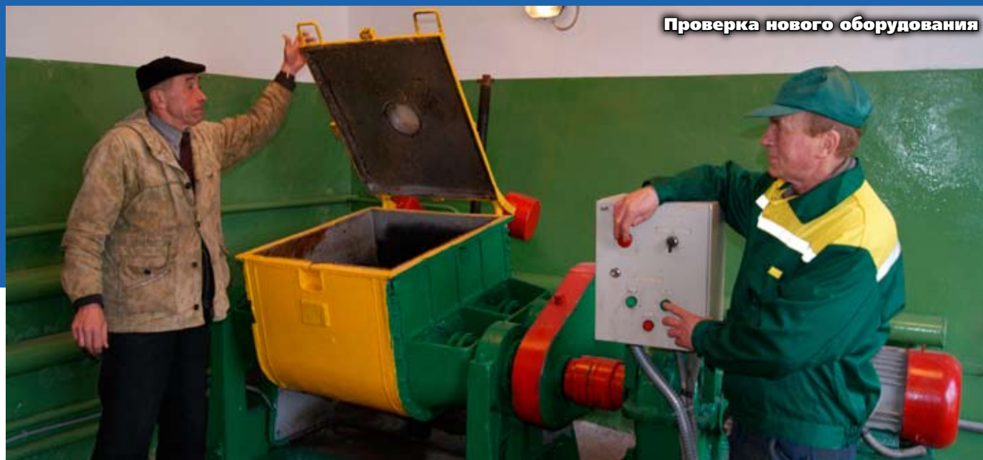
Проверка нового оборудования

Название проекта говорит само за себя. Промышленное производство — одно из основных в деятельности человека. И на каждой стадии любого технологического процесса появляются отходы. Степень опасности промышленных отходов зависит от таких безвредных материалов, как песок, вплоть до диоксинов, являющихся одними из самых токсичных веществ. Удаление вредных отходов, угрожающих как состоянию окружающей среды, так и здоровью человека, — неотложная задача не только местного масштаба, но и задача глобальной