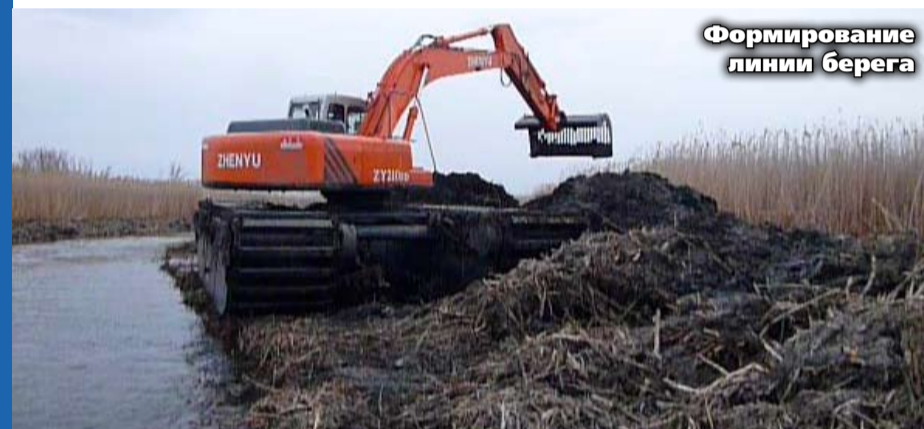
Формирование линии берега

Состояние малых рек в Воронежской области требует постоянного внимания и системной работы по их очистке и благоустройству. Инновационный способ, предложенный ООО «Спецпрома 1», делает эту работу более эффективной.