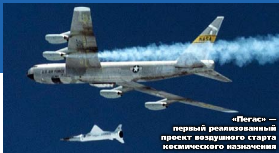
«Пегас» — первый реализованный проект воздушного старта космического назначения

Это инновационная ракетно-космическая программа, целью которой является доставка самолетом Ан-124-100 «Руслан» на высоту 10-11 км двухступенчатой ракеты-носителя массой около 100 тонн. В заданной точке происходит десантирование ракеты, через 6 секунд включаются двигатели первой, затем второй ступеней, и ракета выводит спутник на околоземную космическую орбиту. Масса спутника может достигать 3,5 тонны, что в несколько раз больше, чем в существующей в США подобной системе. Стоимость выведения одного килограмма полезного