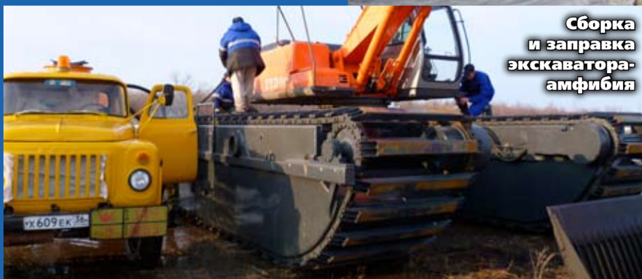
Сборка и заправка экскаватора-амфибия

Воронежское инновационное предприятие ООО «Спецпром 1» разработало современную технологию очистки малых рек. Это позволило предприятию выиграть тендер на благоустройство озера на улице Минской, объявленный в рамках подготовки к празднованию 425-летия Воронежа. В основе проводимых работ лежит метод восстановления береговой линии с помощью подводной опалубки.