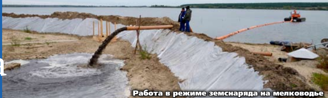
Работа в режиме земснаряда на мелководье

Предприятие неоднократно в различных регионах страны проводило полную реконструкцию малых водоемов с целью улучшения экологической обстановки и повышения коммерческой цены близлежащих земель, а также берегоукрепления с использованием универсальных гибких защитных бетонных матов. В «Спецпроме 1» имеет-